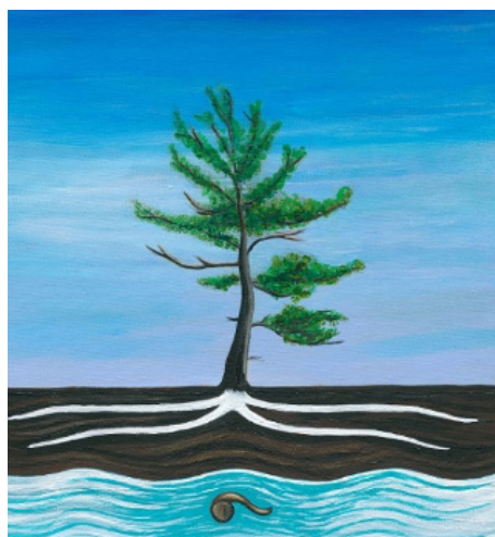
Représentation rotinonhsyón:ni du concept de respect