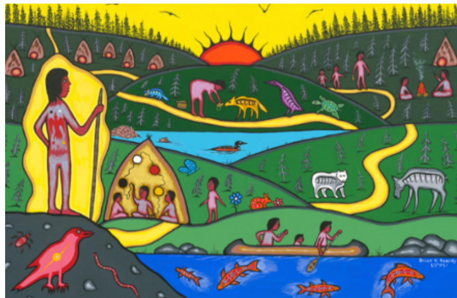
Représentation de la norme d'exercice Perfectionnement professionnel continu

Les membres savent que le perfectionnement professionnel continu fait partie intégrante d'une pratique efficace et influence l'apprentissage des élèves. Les connaissances, l'expérience, les recherches et la collaboration nourrissent la pratique professionnelle et pavent la voie de l'apprentissage autonome.