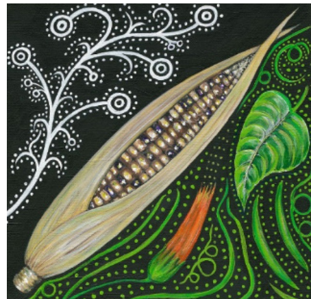
Représentation rotinonhsyón:ni du concept d'intégrité