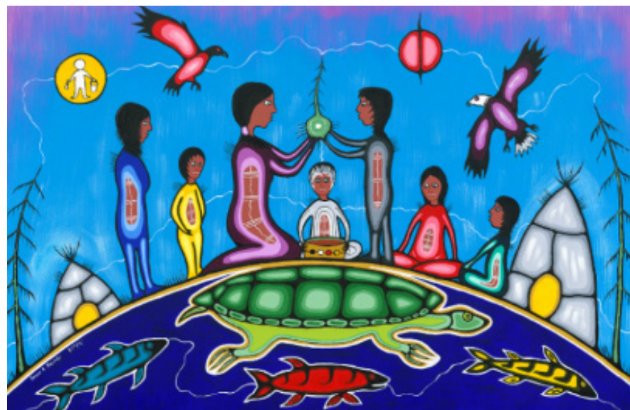
Représentation de la norme d'exercice Engagement envers les élèves et leur apprentissage

Les membres se soucient de leurs élèves et font preuve d'engagement envers eux. Ils les traitent équitablement et respectueusement et sont sensibles aux facteurs qui influencent l'apprentissage de chaque élève. Les membres encouragent les élèves à devenir des citoyennes et citoyens actifs de la société canadienne.