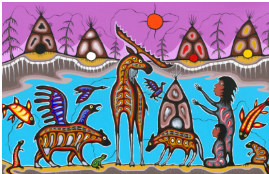
Représentation de la norme d'exercice Leadership dans les communautés d'apprentissage

Les membres encouragent la création de communautés d'apprentissage dans un milieu sécuritaire où règnent collaboration et appui, et y participent. Ils reconnaissent la part de responsabilité qui leur incombe et assument le rôle de leader afin de favoriser la réussite des élèves. Les membres respectent les normes de déontologie au sein de ces communautés d'apprentissage et les mettent en pratique.