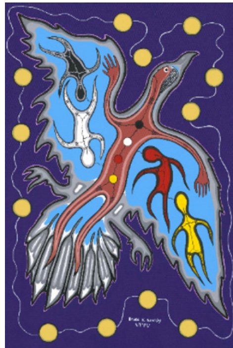
Représentation de la norme d'exercice Pratique professionnelle

Les membres de l'Ordre s'appuient sur leurs connaissances et expériences professionnelles pour diriger les élèves dans leur apprentissage. Ils ont recours à la pédagogie, aux méthodes d'évaluation, à des ressources et à la technologie pour planifier leurs cours et répondre aux besoins particuliers des élèves et des communautés d'apprentissage. Les membres peaufinent leur pratique professionnelle et cherchent constamment à l'améliorer par le questionnement, le dialogue et la réflexion.