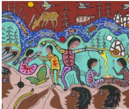
Représentation anishinaabe du concept de confiance

Le concept de confiance incarne l'objectivité, l'ouverture d'esprit et l'honnêteté. Les relations professionnelles des membres avec les élèves, les collègues, les parents, les tutrices et tuteurs ainsi que le public reposent sur la confiance.