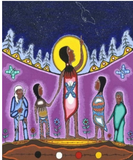
Représentation anishinaabe du concept d'empathie

Le concept d'empathie comprend la compassion, l'acceptation, l'intérêt et le discernement nécessaires à l'épanouissement des élèves. Dans l'exercice de leur profession, les membres expriment leur engagement envers le bien-être et l'apprentissage des élèves par l'influence positive, le discernement professionnel et le souci de l'autre.