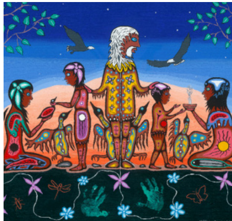
Représentation anishinaabe du concept de respect

La confiance et l'objectivité sont intrinsèques au concept de respect. Les membres honorent la dignité humaine, le bien-être affectif et le développement cognitif. La façon dont ils exercent leur profession reflète le respect des valeurs spirituelles et culturelles, de la justice sociale, de la confidentialité, de la liberté, de la démocratie et de l'environnement.