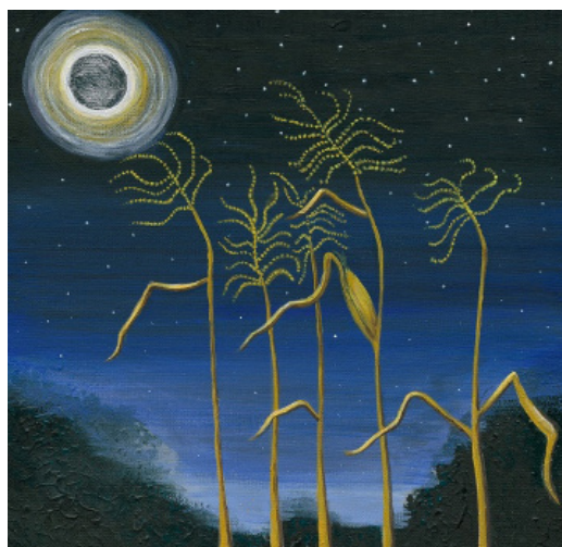
Représentation rotinonhsyón:ni du concept de confiance